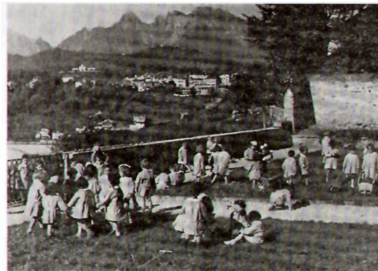
Il vecchio giardino con affaccio sul Piave negli anni '930.