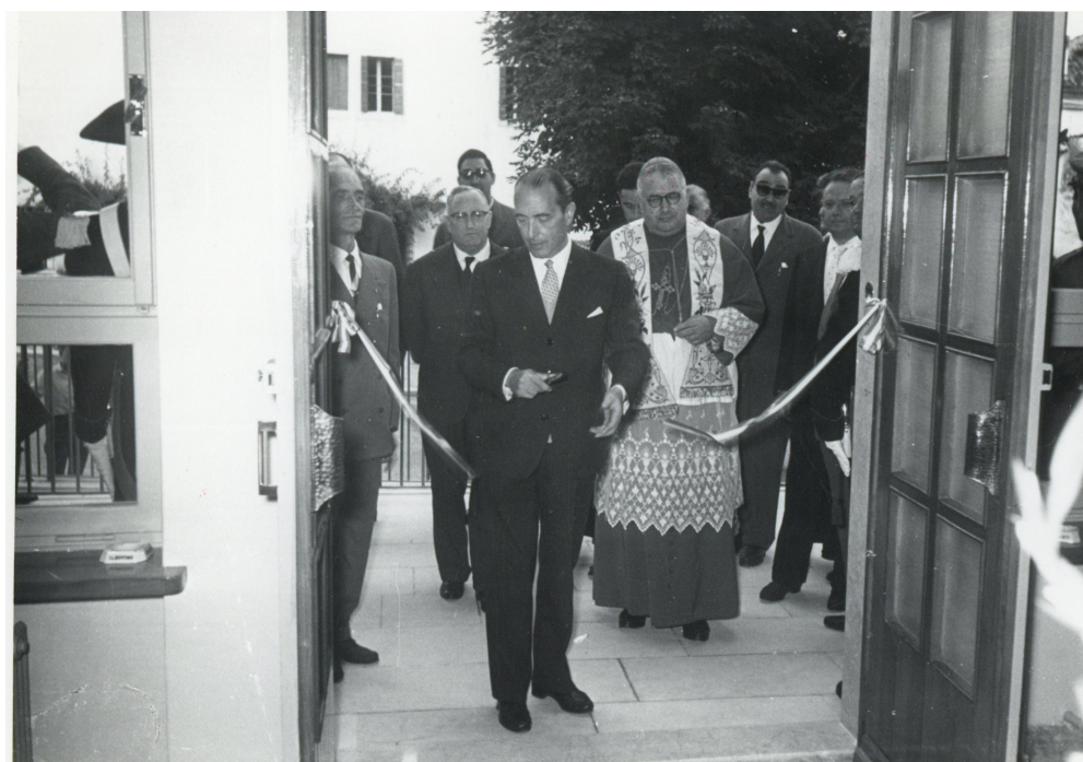
Alla cerimonia d'inaugurazione tenutasi il 22 agosto 1957 intervennero la cittadinanza e autorità civile e religiose ed anche il ministro dell'Interno on. Ferdinando Tambroni che tagliò il